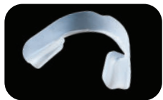
UltraFit™-bitje vóór plaatsing